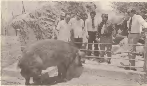
Cria di porco di raza na Santa Rosa pa promove produccion di carni.

gobierno a contrata un veterinario pa un periodo di 3 aña.